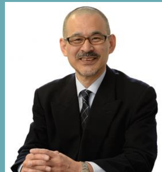
「小さな会社の販売戦略」を設計する専門家

= Y's CLUB = の卒業は自身で決めていただくことができます。つまり自分のペースで課題を決め解決することができるようになっていきます。小さな企業の場合、一足飛びに高い目標に向かってしまうのはリスクが大きすぎる場合があります。今できる範囲で最高のパフォーマンスをめざして取り組む。実際に参加者の多くはこうして数期に渡ってじっくりと自分のビジネスモデルを構築しています。